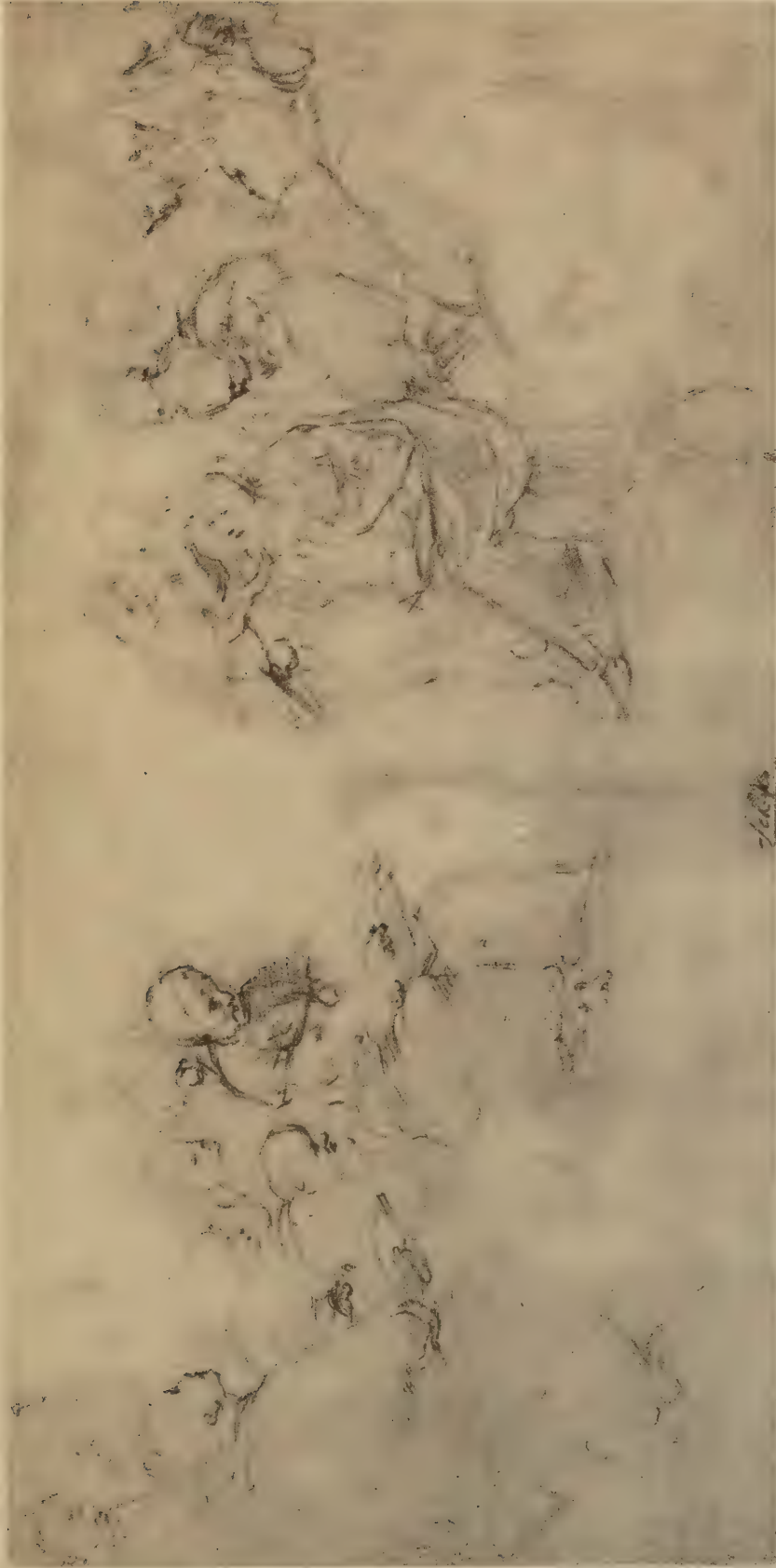
Etude pour la partie inférieure de la Dispute du Saint-Sacrement